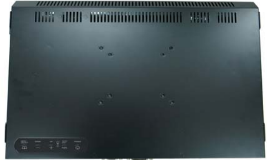
※註 2 : R03W (OSD key 置於螢幕後方)