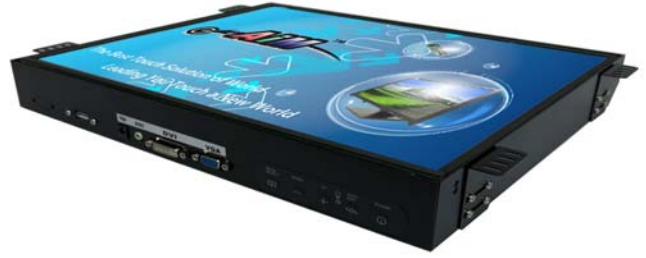
※註 1 : R01W (OSD key 置於螢幕下方)