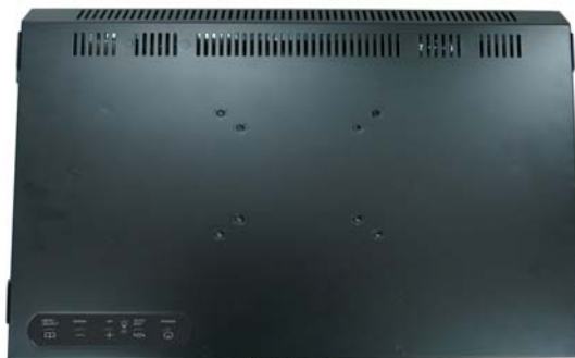
※註 2 : R03W (OSD key 置於螢幕後方)