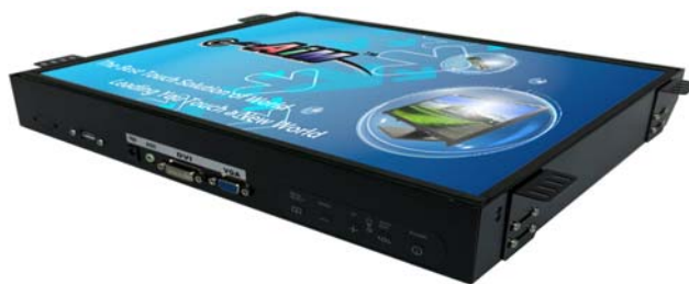
※註 1 : R01W (OSD key 置於螢幕下方)