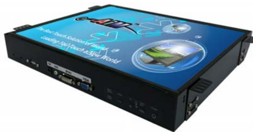
※註 1: R01 (OSD key 置於螢幕下方)