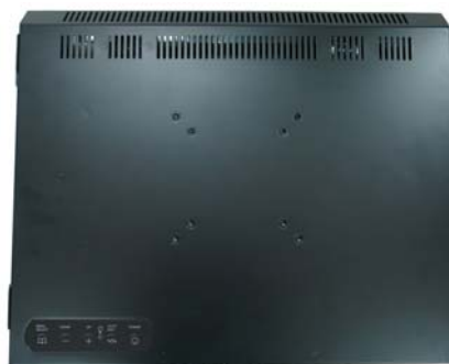
※註 2: R03 (OSD key 置於螢幕後方)