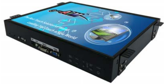
※註 1: R01 (OSD key 置於螢幕下方)