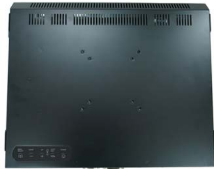
※註 2: R07 (OSD key 置於螢幕後方)